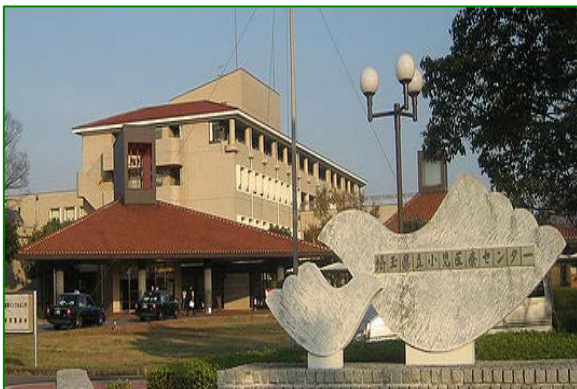
埼玉県立小児医療センター