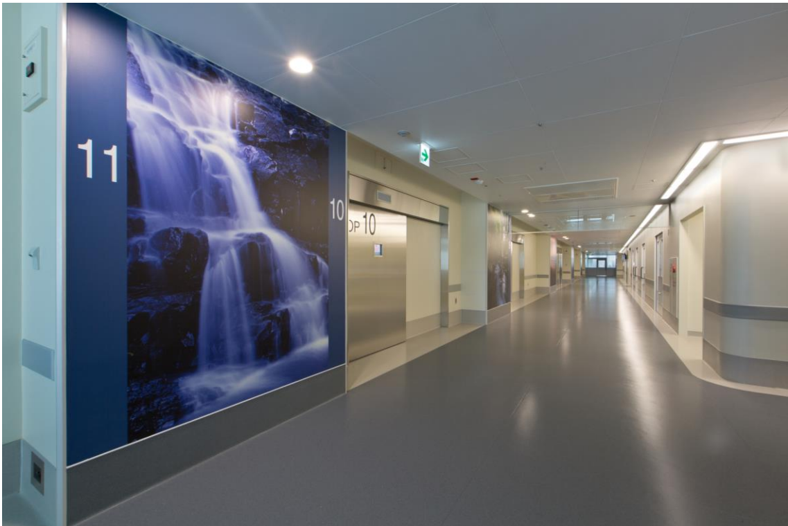
大阪医科大学附属病院手術棟3階