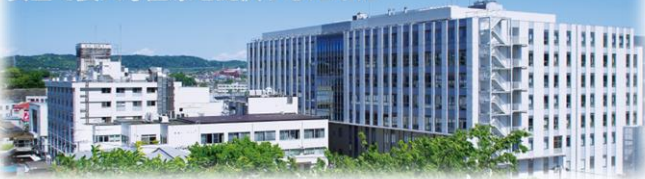
患者さまのニーズに応えた 安全で良質な医療を提供するために