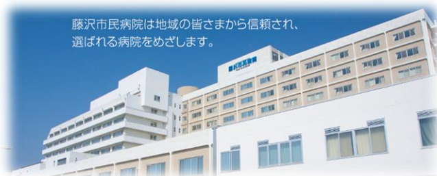
藤沢市民病院は地域の皆さまから信頼され、 選ばれる病院をめざします。